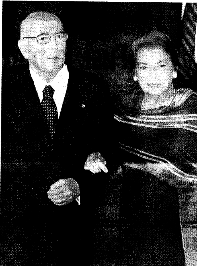
Il Capo dello Stato Giorgio Napolitano con la moglie Clio da oggi a Torino

al Politecnico l'Anno accademico Seguirà la sede Onu, il World Political Forum e il via a Terra Madre